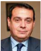
Jaime Cabrero García Presidente del Consejo General de los COAPI en España

En la actualidad, algunas empresas (pymes, micropymes...) y ciudadanos se encuentran en un escenario de mayor vulnerabilidad debido a la situación de dificultad económica grave que están atravesando causada en casos de desempleo, acumulación de deudas, etc. Ante estos hechos, hemos querido acercarnos a algunas profesiones que consideramos pueden aconsejarles la manera de gestionar los riesgos a asumir en estas circunstancias.